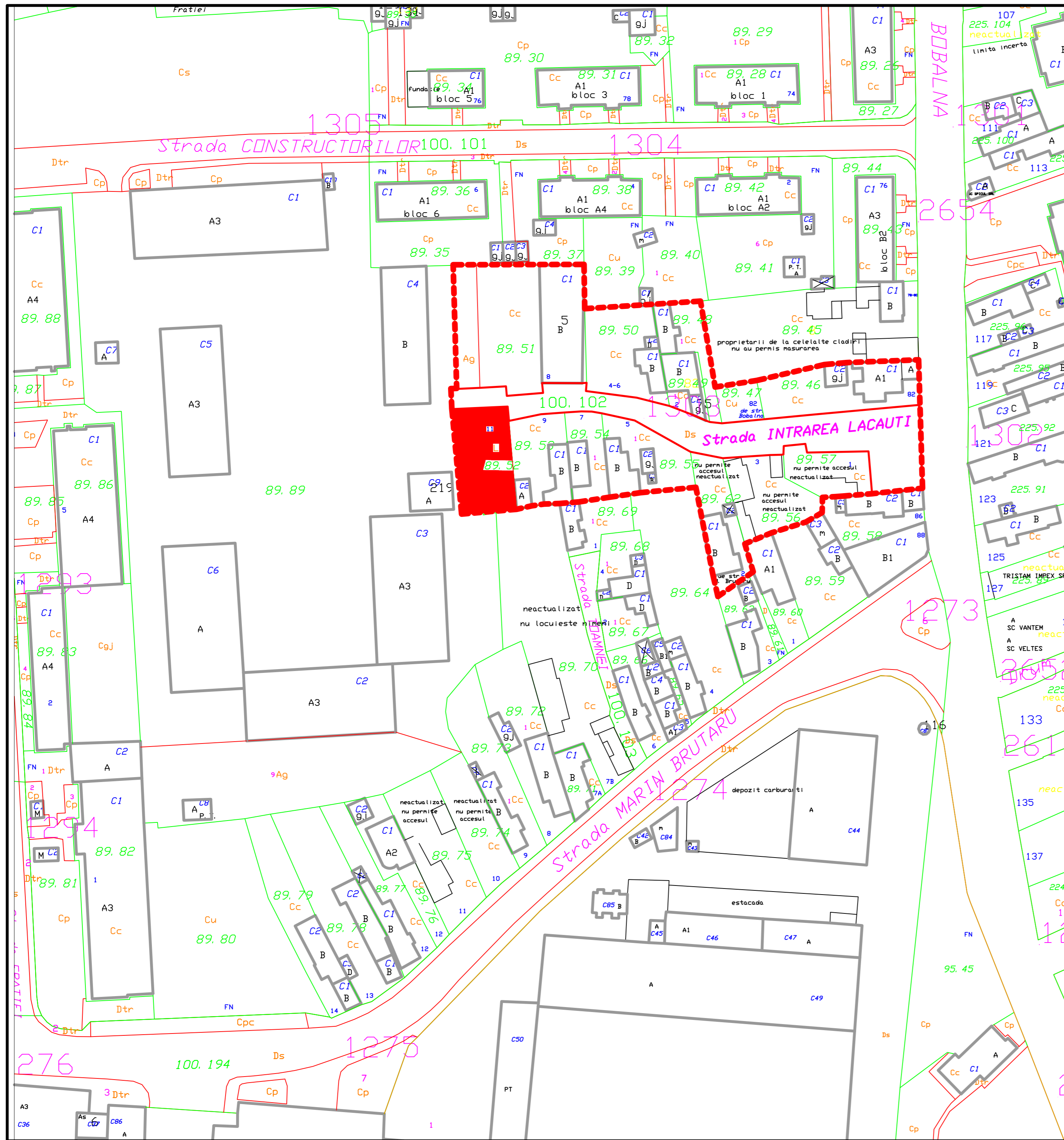
Plansa nr. 1 - Incadrare in teriroriu